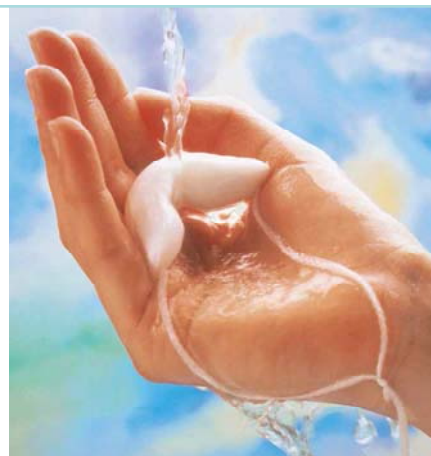
Contrelle Activgardi peab enne kasutamist veega immutama.

Taanis läbi viidud uuringute põhjal ei muutu ei pH ega loomulik bakteriaalne tasakaal. Samuti ei suurene tupe- või põiepõletike ega limaskesta ärrituse risk. Activgardi paigaldamist lihtsustab tupekreemi kasutamine; vanematel patsientidel võib kasu olla lokaalsest hormoonravist.