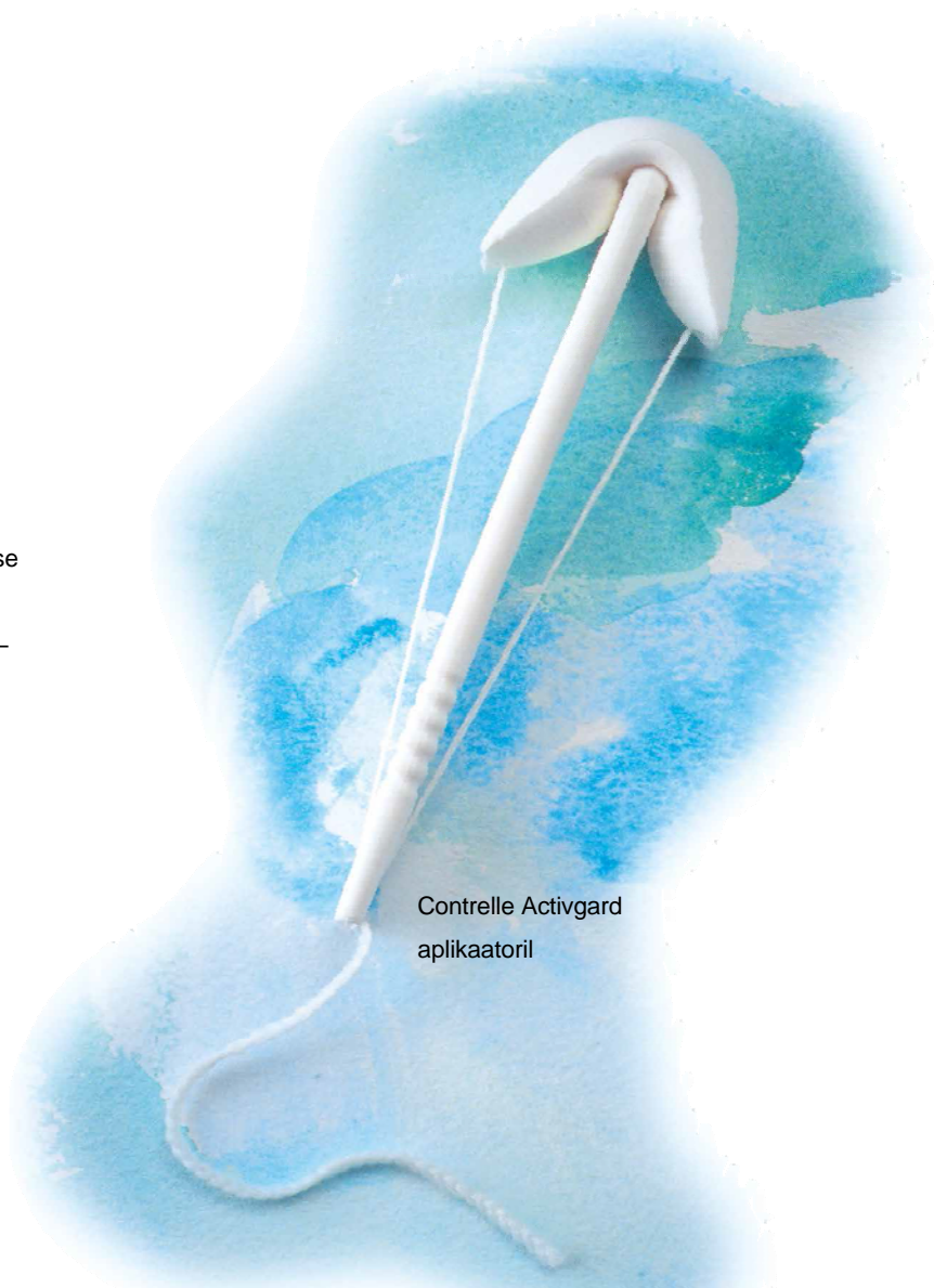
Contrelle Activgard aplikaatoril

Contrelle Activgard paigaldatakse tuppe, nii et see on sama märkamatu ja diskreetne kui tampoon. Seda võib vahetamata kanda kuni 16 tundi päevas. Contrelle Activgard on ühekordselt kasutatav toode, mida kantakse ühe korra ja visatakse siis minema.